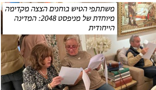
משתתפי הטיש בוחנים הצעה מקדימה מיוחדת של מניפסט 2048: המדינה הייחודית