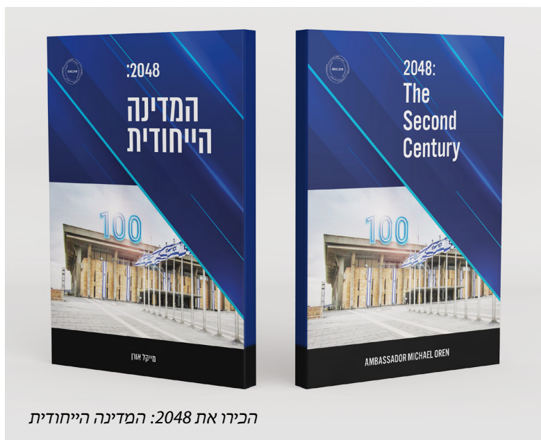
הכירו את 2048: המדינה הייחודית

בינתיים, השגריר אורן ממשיך להופיע כפרשן ברשתות התקשורת הגדולות, תוך פרסום מאמרים במגוון רחב של סוגיות רלוונטיות הקשורות לישראל.