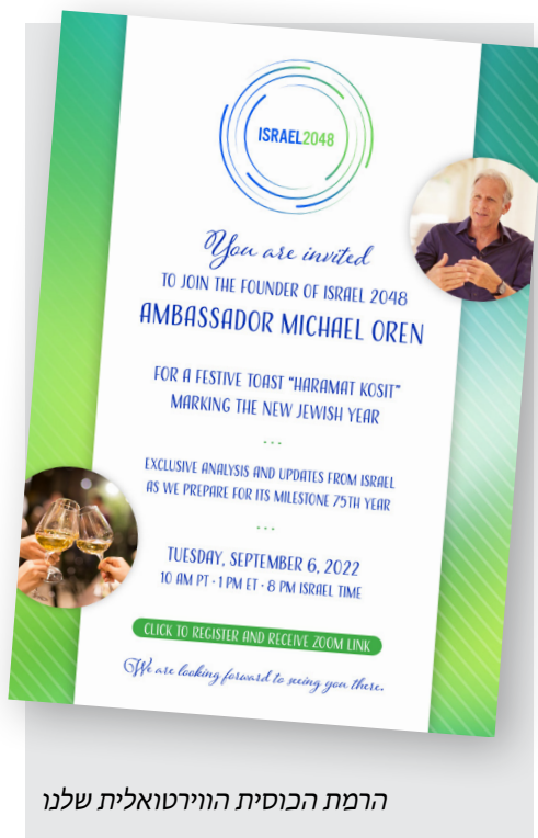
הרמת הכוסית הוירטואלית שלנו

במהלך החודשים הקרובים, נקבל בברכה את חברי הוועדה המייעצת הגלובלית החדשה שלנו.